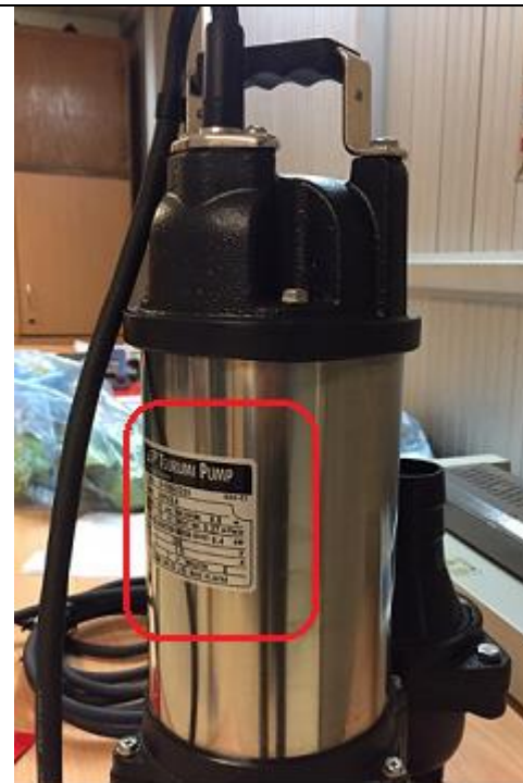
Tem bơm nằm trên thân máy bơm