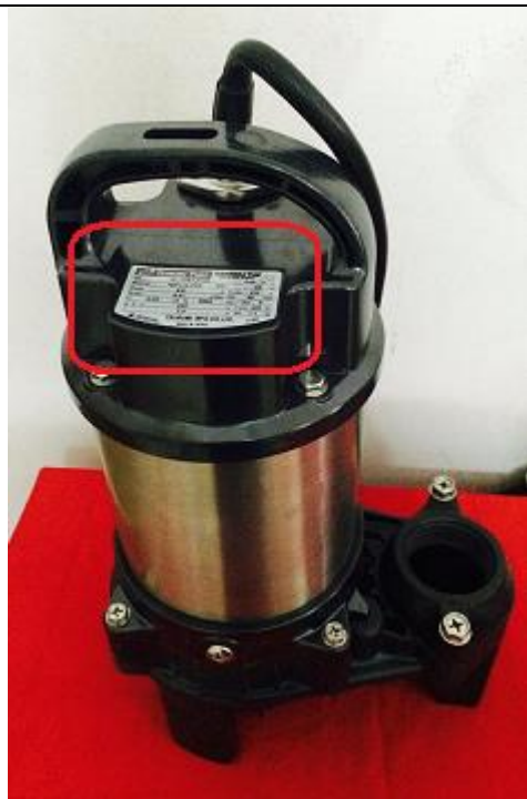
Tem bơm nằm phía trên đầu bơm